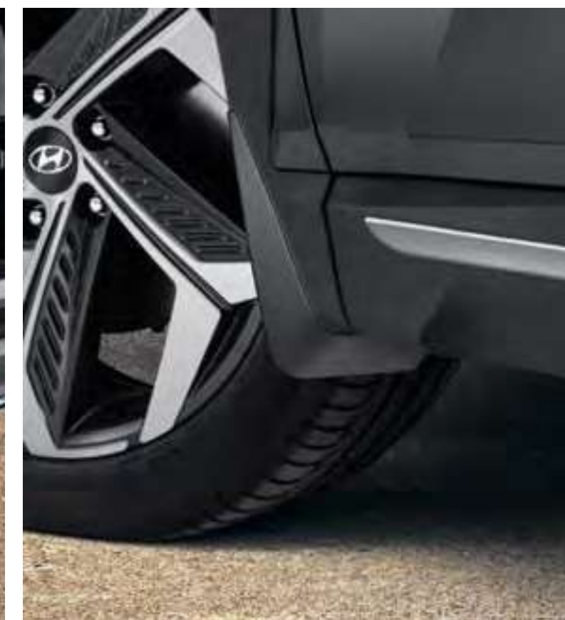
Set de guardabarros delanteros, CWF46ACA00E