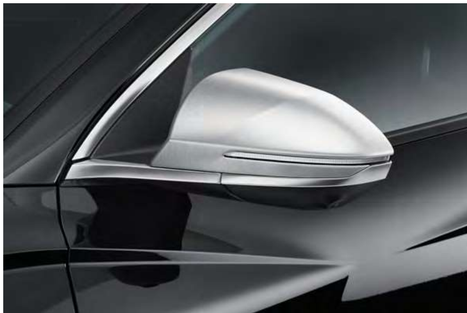
Set de cubiertas para espejos retrovisores, N7431ADE00BR