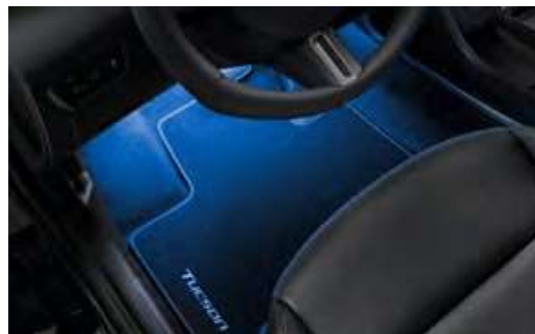
Set iluminación interior led, azul, plazas delanteras, 99650ADE20