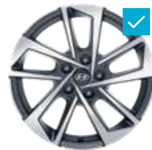
Llanta de aleación de 17", Itaewon, bicolor, N7400ADE07BC