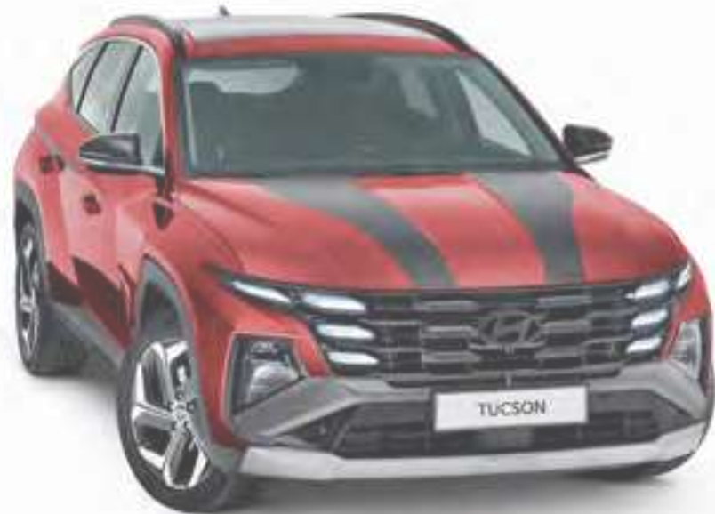
Set adhesivos Racing, negro mate N7200ADE00BL