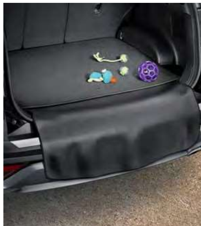
Protector textil plegable para la alfombrilla de maletero, 55120ADE00