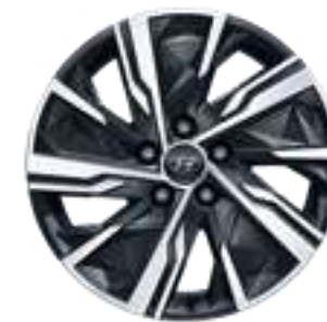
Llanta de aleación de 17", 52910N7160PAC