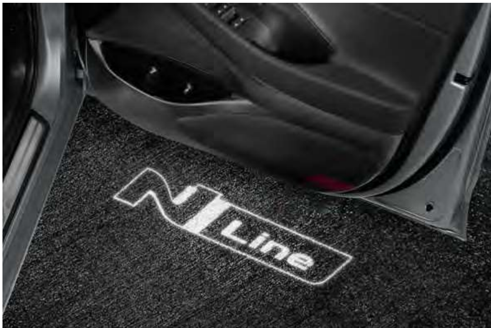
Set iluminación inferior puerta, logotipo N Line, 99651ADE00NL