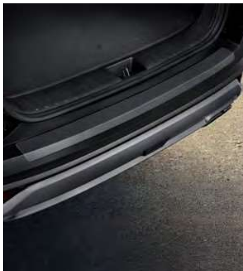
Lámina adhesiva de protección para el paragolpes trasero, negra

Esta lámina negra protege la superficie superior del paragolpes trasero de arañazos y roces.