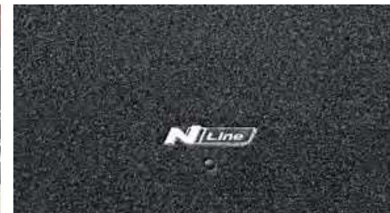
Alfombra para el maletero, logotipo N Line, N7120ADE00NL