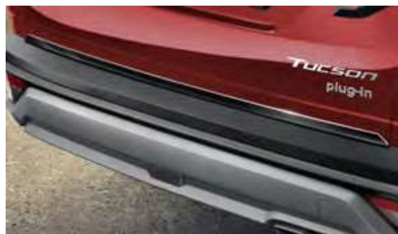
Moldura portón trasero, N7491ADE00BL