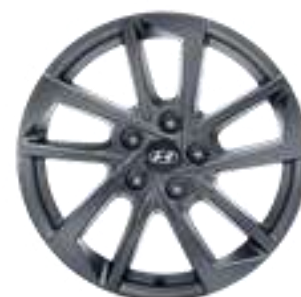
Llanta de aleación de 17", Itaewon, grafito, N7400ADE07GR