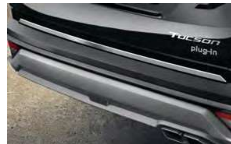
Moldura portón trasero, N7491ADE00BR