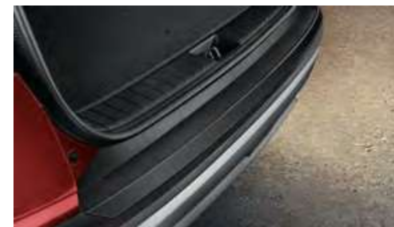
Moldura embellecedora paragolpes trasero (black grained), N7274ADE00