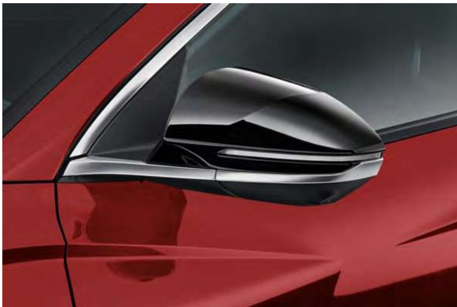
Set de cubiertas para espejos retrovisores, N7431ADE00BL