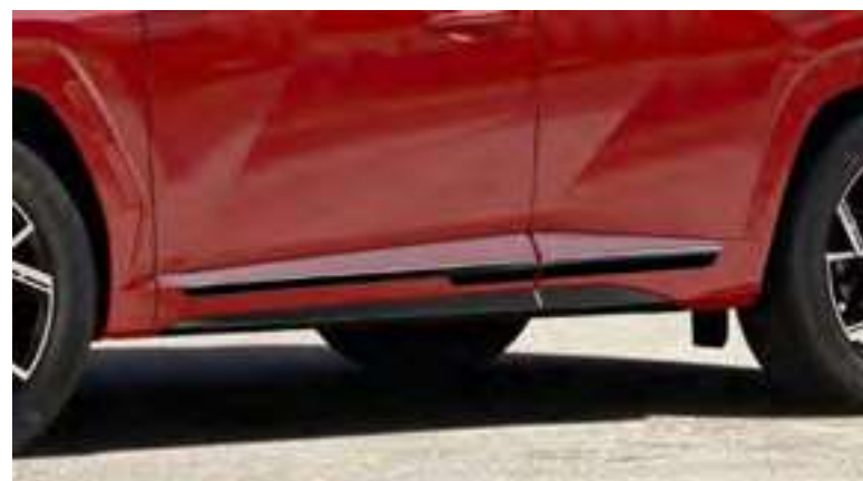
Molduras embellecedoras laterales, N Line, color negro, N7271ADE00BLNL