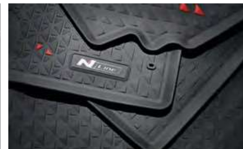
Alfombrillas de goma, N7131ADE00NL, CZ131ADE00NL, CZ131ADE00PHNL