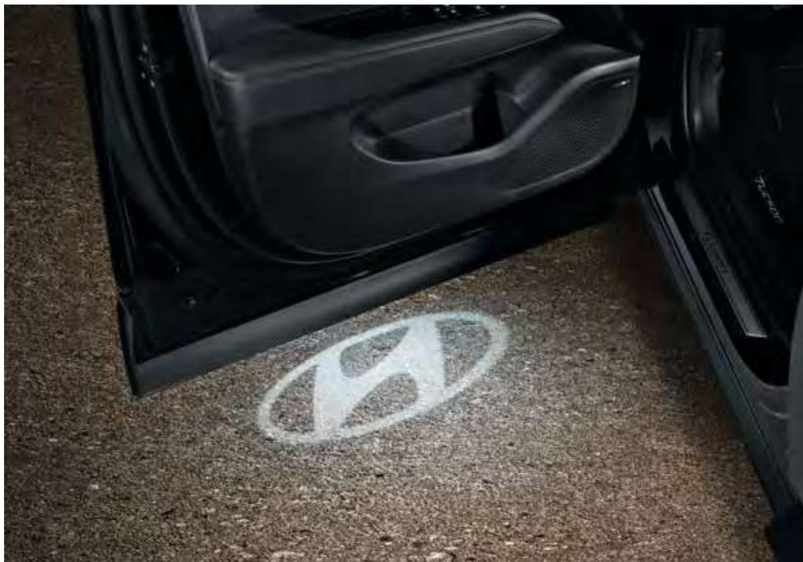
Set iluminación inferior puerta, logotipo de Hyundai 99651ADE00H

Tanto si eliges la luces brillantes o las sutiles, las blancas o las azules, crea un ambiente acogedor con una agradable luz de bienvenida cuando se abren las puertas.