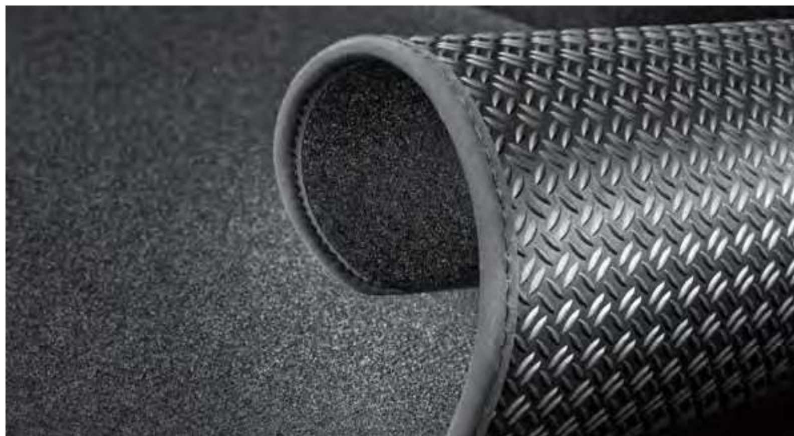
Alfombrilla para el maletero reversible, N7120ADE05

Por eso ofrecemos accesorios a medida para mantener el interior y el exterior de tu coche como nuevo.