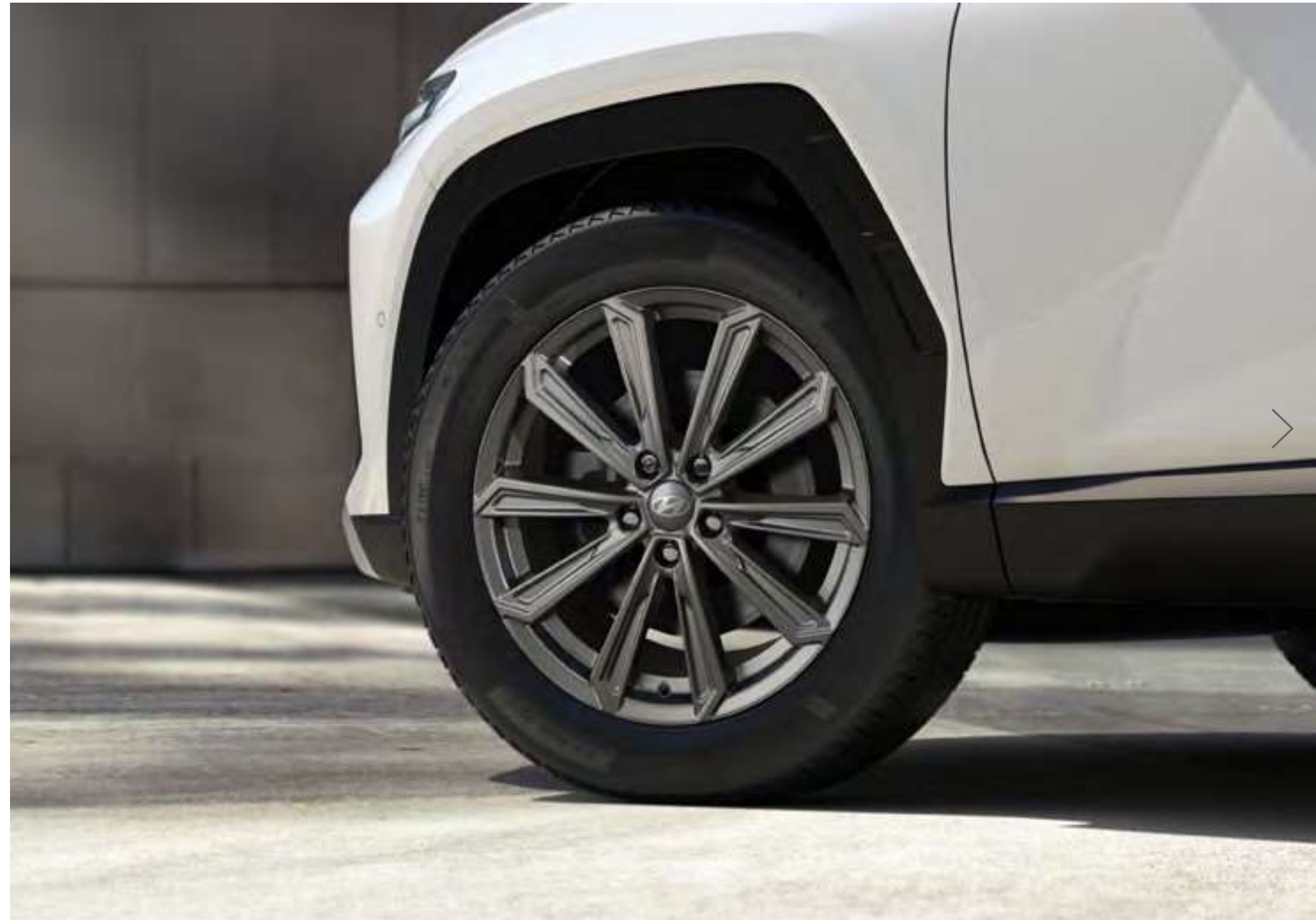
Tuercas antirrobo, cromo oscuro, 99490ADE50DC