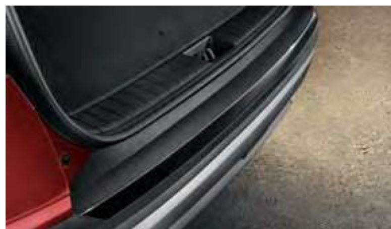
Moldura embellecedora paragolpes trasero (piano black), N7274ADE00BL