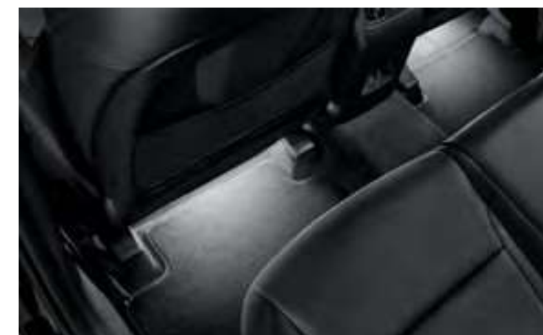
Set iluminación interior led, blanco, plazas traseras, 99650ADE31W