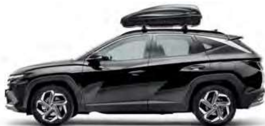
Baúl portaequipajes 330, 144 x 86 x 37.5 cm, 99730ADE10

Disfrutarás de más momentos de acción y el mínimo esfuerzo de carga. Te ofrecemos una amplia gama de sistemas de transporte fáciles y eficaces.