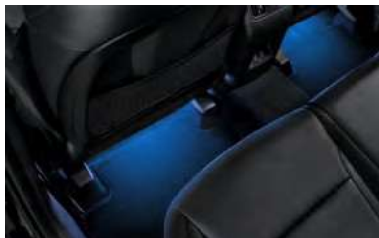
Set iluminación interior led, azul, plazas traseras, 99650ADE31