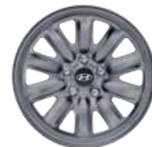
Llanta de acero de 17", N7401ADE07