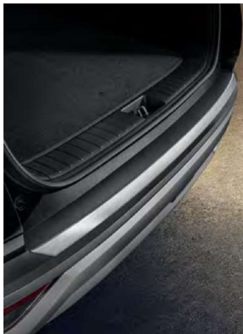
Moldura embellecedora paragolpes trasero, N7274ADE00BR