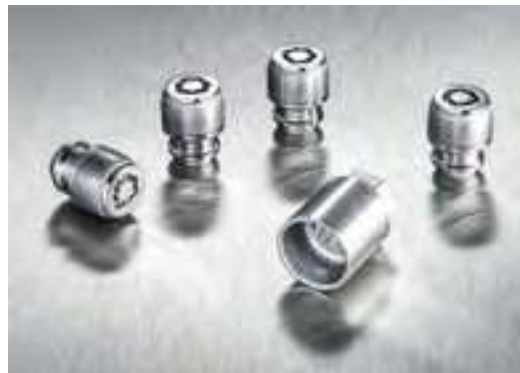
Tuercas antirrobo, 99490ADE51

Nada puede superar el efecto que tienen unas buenas llantas de aleación en la estética de un coche. Y estas llantas han sido diseñadas y fabricadas siguiendo los estrictos estándares de Hyundai.