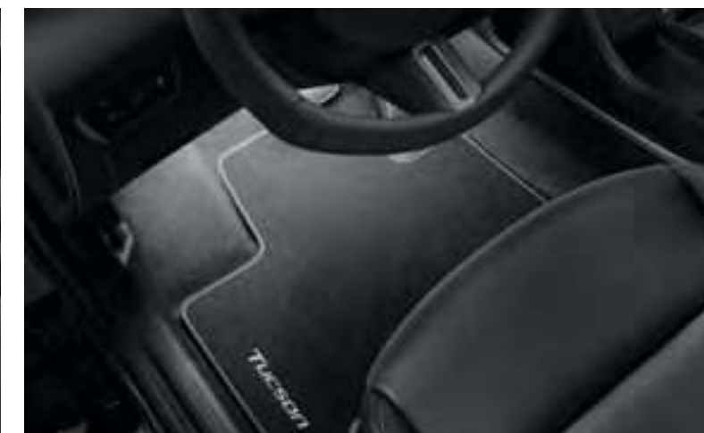
Set iluminación interior led, blanco, plazas delanteras, 99650ADE20W