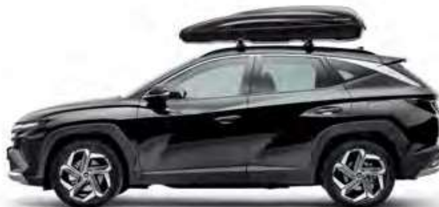
Baúl portaequipajes 390, 195 x 73.8 x 36 cm, 99730ADE00