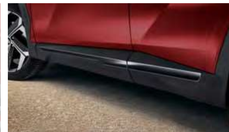
Set molduras embellecedoras laterales, N7271ADE00BL