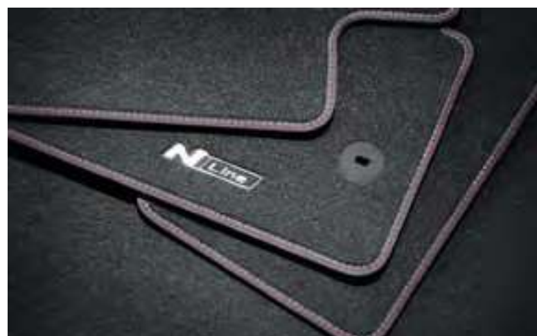
Alfombrillas textiles, velour, N7143ADE00NL, CZ143ADE00NL, CZ143ADB00PHNL