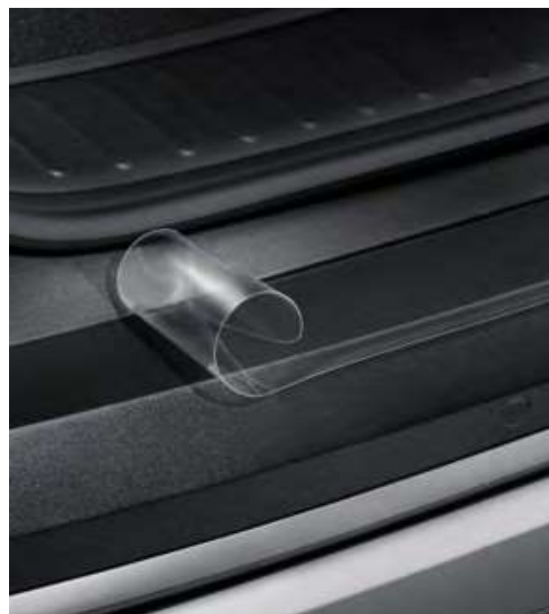
Lámina adhesiva de protección para el paragolpes trasero, transparente

Esta eficiente y discreta lámina adhesiva protege el paragolpes trasero de posibles daños mientras cargas y descargas cualquier objeto.