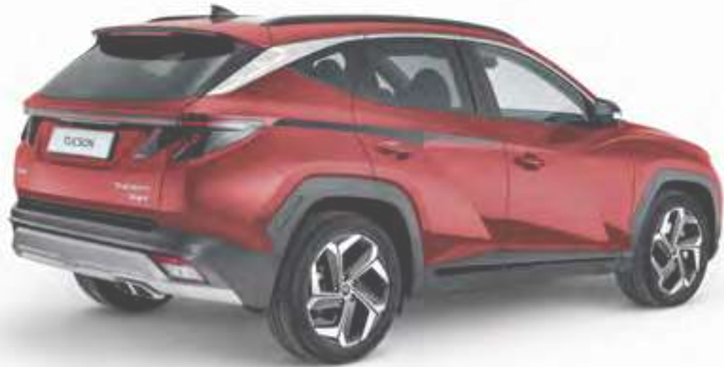
Set adhesivos Sport, negro mate N7200ADE10BL