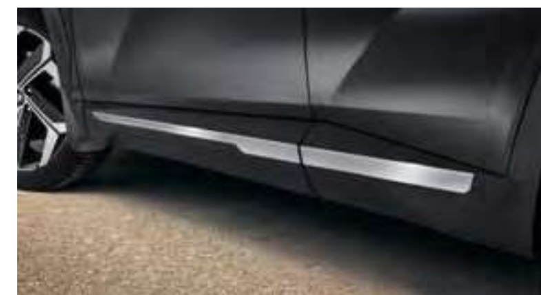
Set molduras embellecedoras laterales, N7271ADE00BR